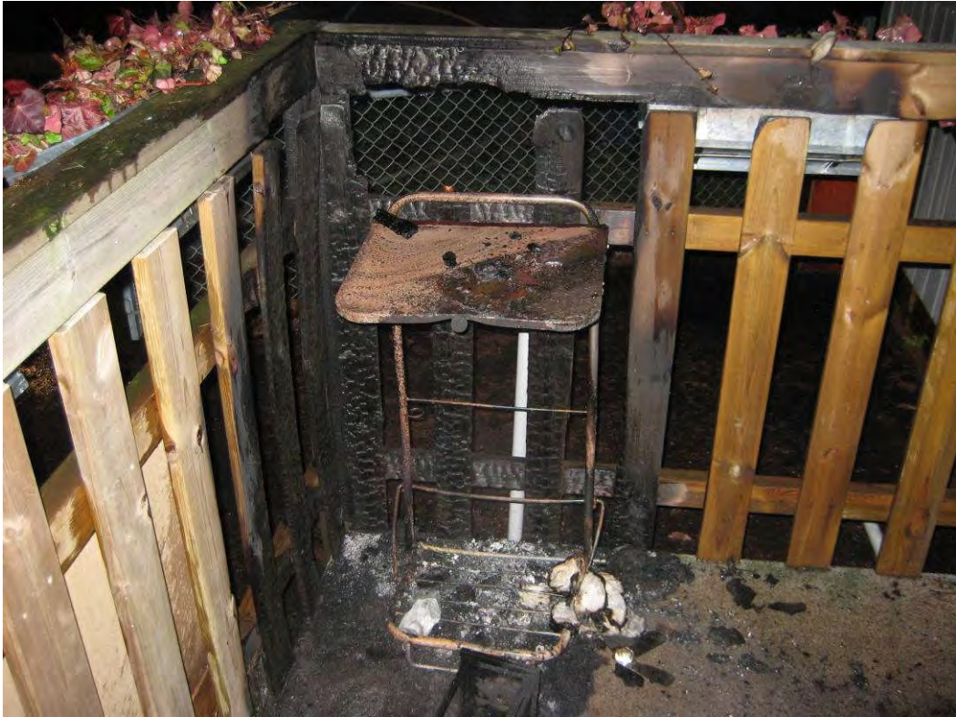
Bild 3. Brandstart.