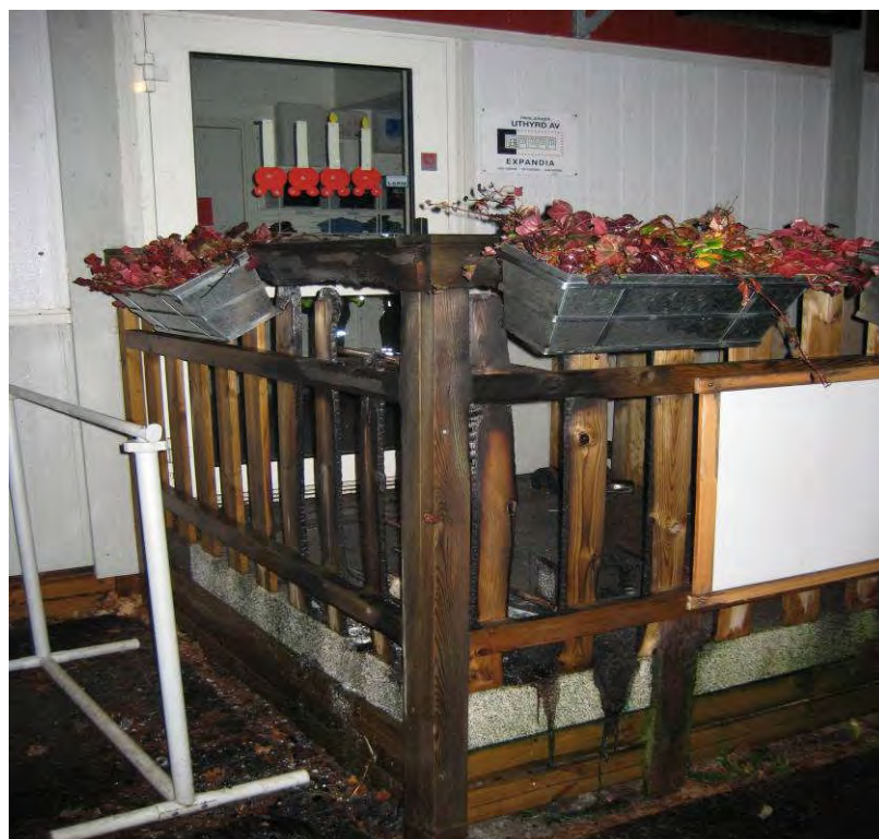
Bild 2. Visar brandskador.