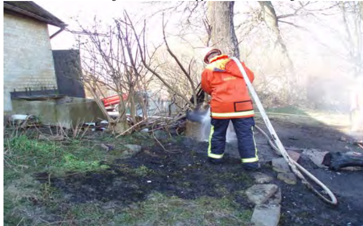
Stubbar och ett träd påverkades rejält av brandspridningen som hotade verkstaden till vänster i bild