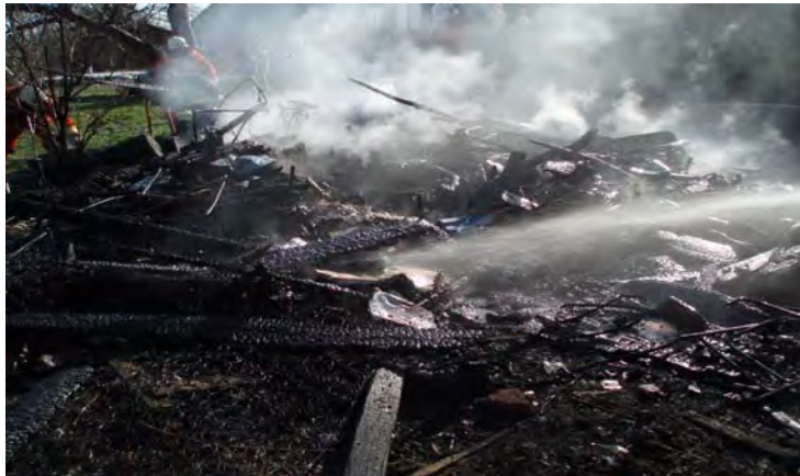
Den osorterade avfallshögen med osorterat uppbränt avfall, bla sängbottnar och däck