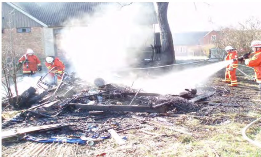
Brandmän från Svalöv och Teckomatorp begränsar spridning med direkt släckinsats i skräphögen

Undersökning/erfarenhetsåterföring genomförd av: Paavo Frick/Carl Albert Andersén