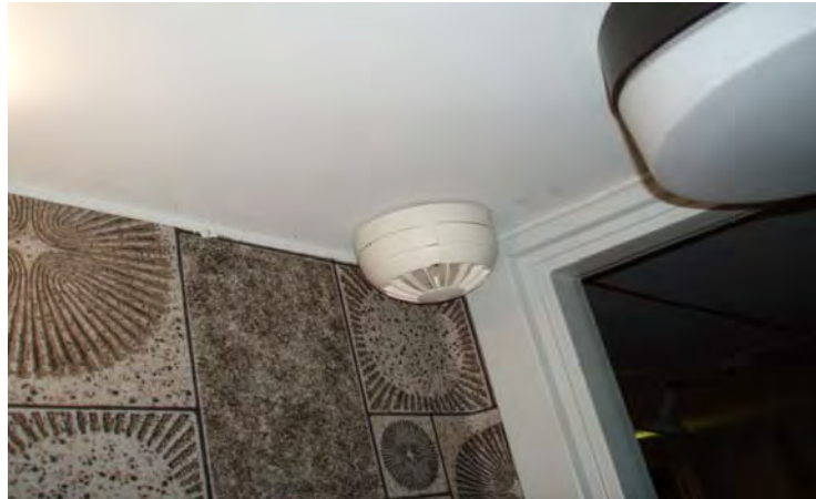
Utlöst rökdetektor i duschrum

Undersökning/erfarenhetsåterföring genomförd av: PF/7 – Paavo Frick/Billy Persson