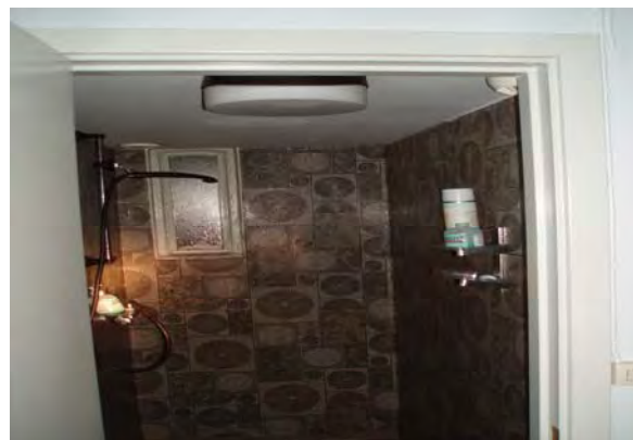
Duschrum sett från logen med detektor till höger