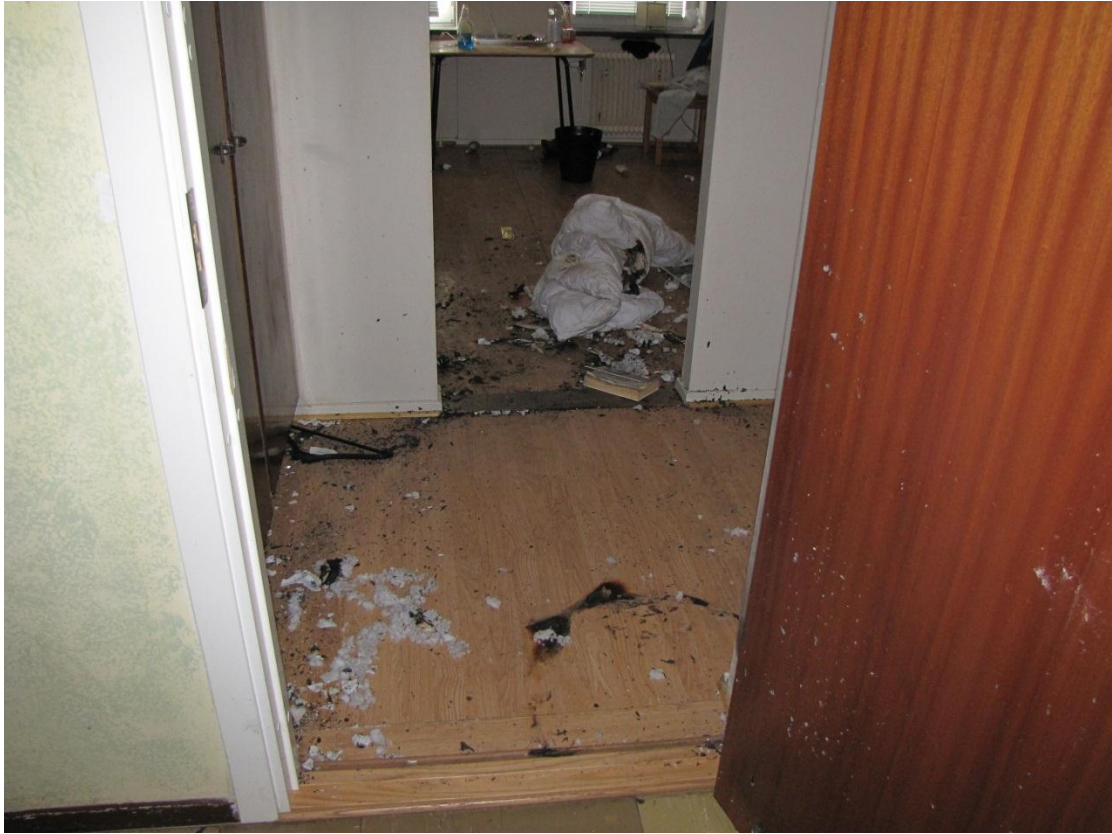
Bild 1. Brandskador i golvet innanför dörr samt brandskadat täcke