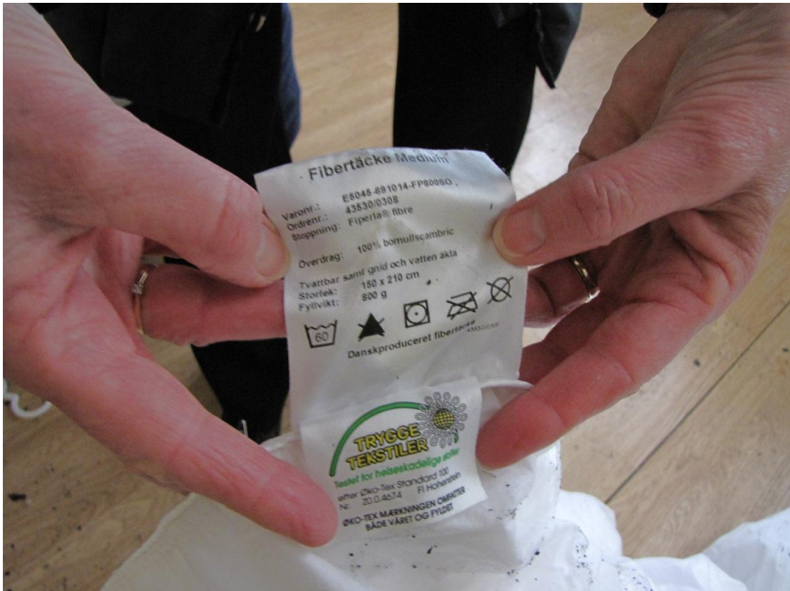
Bild 4. Fibertäcke.