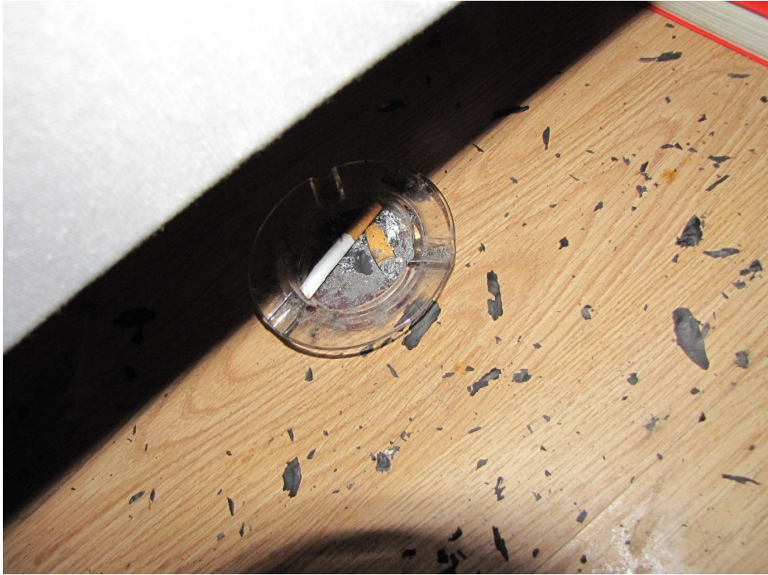
Bild 3. Askfat under sängen