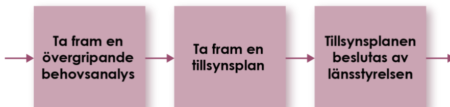
Figur 3 De tre stegen vid planering och framtagande av tillsynsplan för Sevesotillsyn