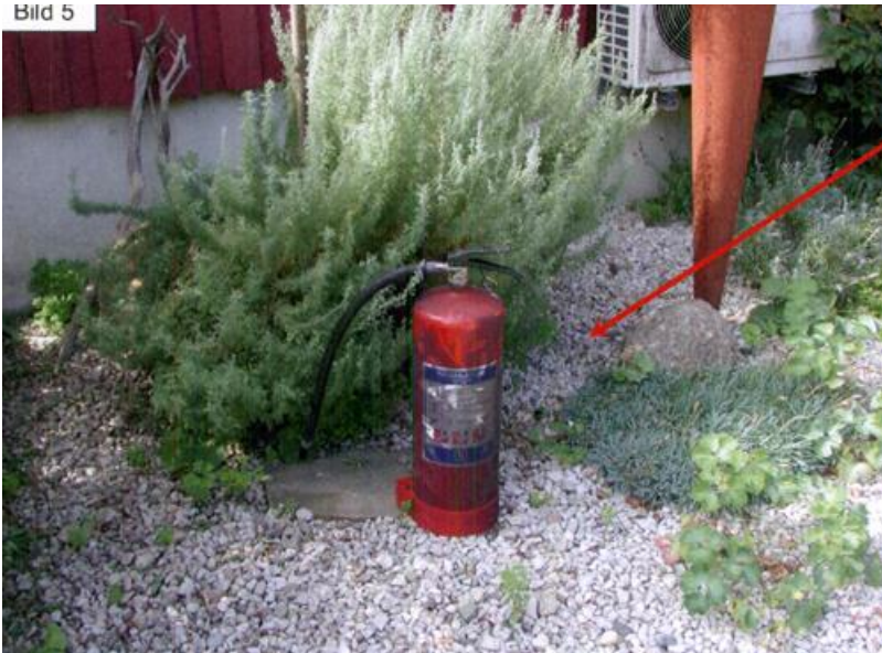
Handbrandsläckaren (pulver 6 kg) vilken branden släcktes med.