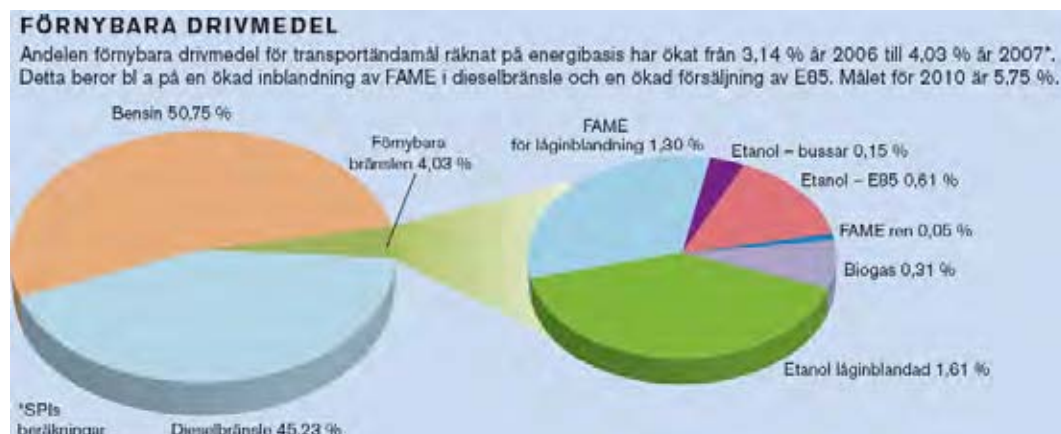
Figur 2 Användning av förnybara bränslen inom drivmedelssidan [3].

För att lyckas med att ersätta oljebaserade bränslen med förnybara bränslen krävs, i varje fall på kort sikt, att man kan tillverka vätskeformiga bränslen som kan utnyttjas som drivmedel inom transportsektorn. Som framgår av Figur 1 så utgjordes ca 75 % av de totala oljeleveranserna 2007 av bensin och dieselbränsle. En process pågår för att ersätta de fossila bränslen med förnybara bränslen och ökningen har varit mycket kraftigt under de senaste åren. Mellan 2000 och 2006 ökade användningen av etanol som drivmedel med nästan 1100 % (från 0,16 TWh till 1,89 TWh) [4]. Under samma period ökade användningen av FAME med ungefär 900 % (från 0,06 TWh till 0,60 TWh). I dagsläget (2007) utgör förnyelsebara bränslen ca 4 % enligt statistik från SPI, se Figur 2. Som framgår av figuren utgörs den stora andelen av låginblandning av FAME i dieseloljan respektive etanol i bensinen, men det sker också en övergång till rena biobränslen. Mest omfattande är satsningen på E85 till s.k. flexifuel-bilar och totalt fanns ca 80000 flexifuel-bilar i slutet av 2007 med en ökning av ca 2000 bilar per månad. Antalet tankstationer med E85-pumpar växer också mycket snabbt och överstiger nu 1000 stationer.