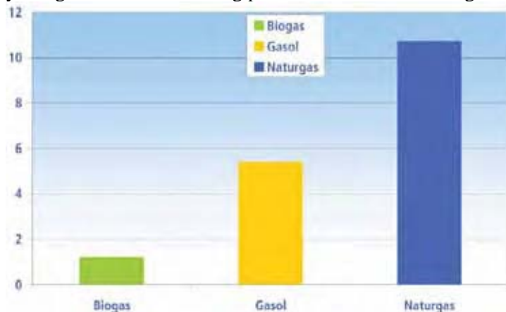
Figur 3 Leveranser av energigaser under 2007 (TWh) [23].

I Figur 3 redovisas fördelningen av leveranser av energigas under 2007 och som framgår av detta är ännu så länge naturgasen helt dominerande. Naturgas och gasol är dock fossila bränslen och målsättningen är alltså att ersätta dessa med gas från förnyelsebara källor vilket innebär ett stort behov av utökad produktion av biogas/syntesgas. Nedan ges lite ytterligare information kring produktion och användning av dessa.