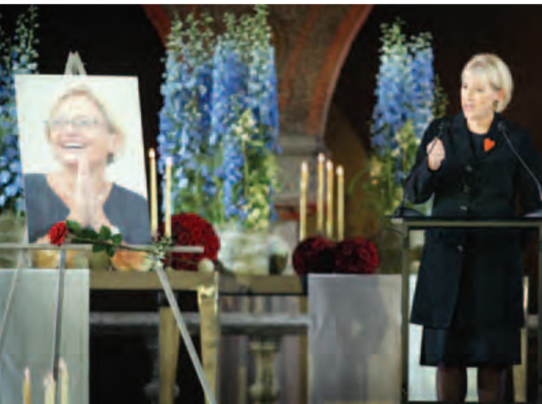
EU-kommissionär Margot Wallström håller tal under minneshögtiden för Anna Lindh i Stockholms stadshus, 19 september 2003.

Det som här beskrivs, märks också tydligt när informanterna med invandrarbakgrund återger hur de reagerade efter attacken och beskedet om Anna Lindhs död. Några berättar att de har haft nära till tårarna – att de har gått undan från kollegor på jobbet för att inte riskera att gråta i andras åsyn. En svensk-somalisk man säger att "man kan gråta på olika sätt – det kan rinna ur ögonen, det finns de som skriker, de som gråter inuti". Han har sett människor gråta på