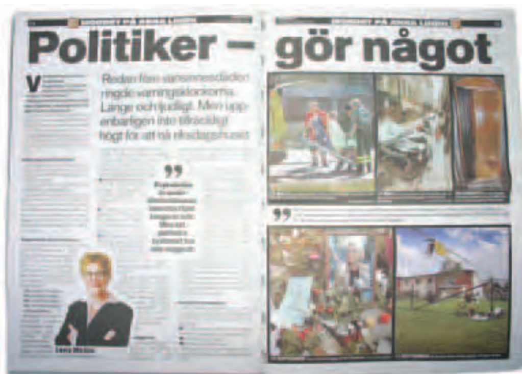
Aftonbladet 27 september 2003.

I vissa fall var de svepande, generaliserande, och i andra fall, då enskilda oegentligheter erinrades, mer specifika. Informanterna lyfte fram kortsiktigheten i nedskärningarna som har gjorts, att politikerna drivs av egenintresse, att det inom politiken, särskilt på kommun- och landstingsnivå, finns en allvarlig kompetensbrist, samt att politiker över huvud taget brister i sin verklighetsförankring – de vet inte hur den vanliga människan har det. Dessa resultat är mycket lika dem som Möller (2000) presenterar från sina intervjuer. Att kritiken är uniform, med nästan