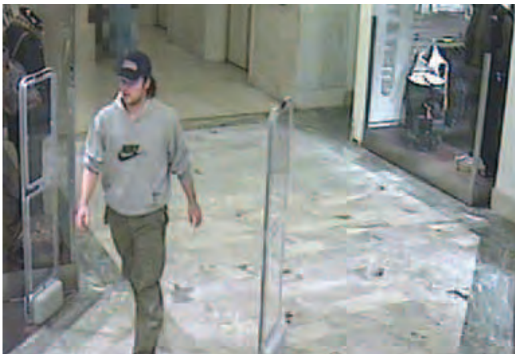
Anna Lindhs utpekade mördare, Mijailo Mijailovic, filmas av NK:s övervakningskamera.

nerna har nära kontakt med personer som inte kan svenska, som – utan hjälp av invandrarföreningar, släktingar och vänner – får det svårt i ett informationsintensivt samhälle.