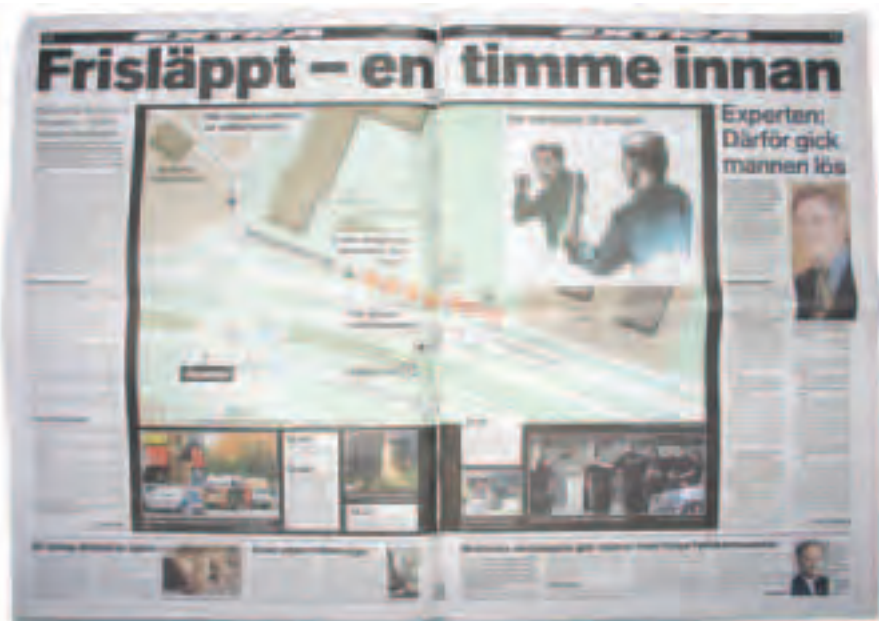
Aftonbladet 20 maj 2003.

"Man kan ju utgå ifrån att ingen fullt frisk person går och slår ihjäl en annan" (Inf 9).