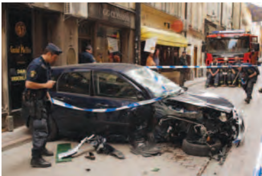
Polisen säkrar brottsplatsen på Västerlånggatan i Gamla stan 31 maj 2003.