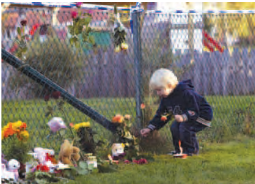
Många barn lämnade leksaker, blommor och teckningar till den mördade femåringen vid mordplatsen.

– Ja, och där tyckte jag media var hem-ska för de skuffade undan det här flicka-barnet – som var mycket jävligare egent-ligen, och så skrev de bara om Anna Lindh bara för att hon var stor (Inf 13).