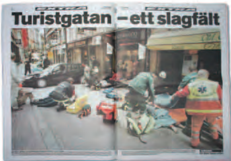
Aftonbladet 1 juni 2003.