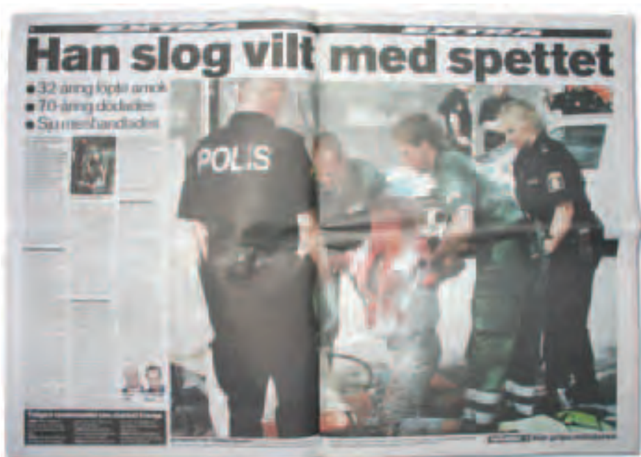
Aftonbladet 20 maj 2003.