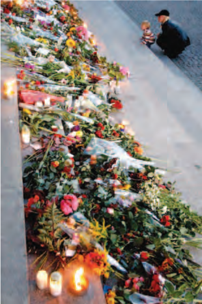
Ett berg av blommor och ljus till den mördade utrikesministern Anna Lindh.