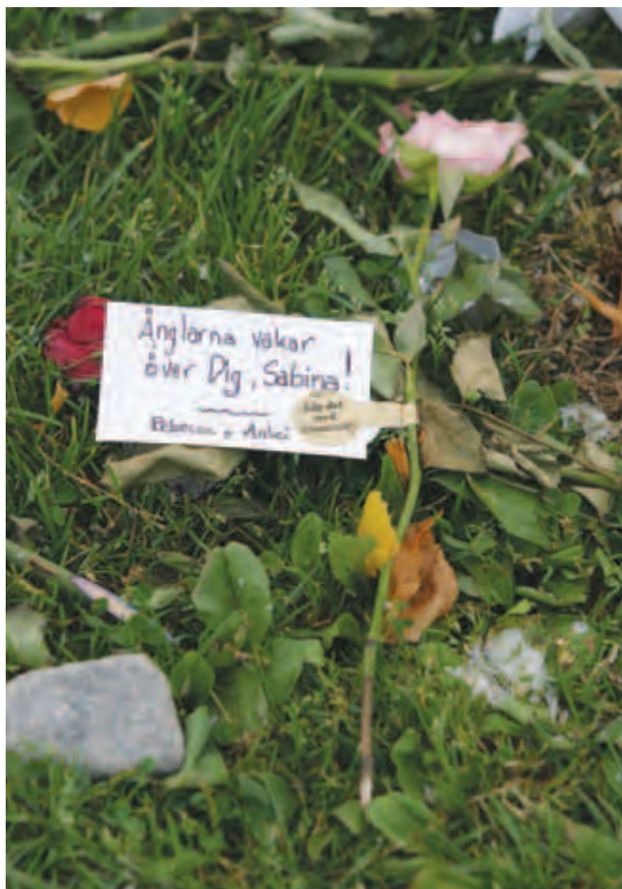
En hälsning till den mördade femåringen i Arvika.