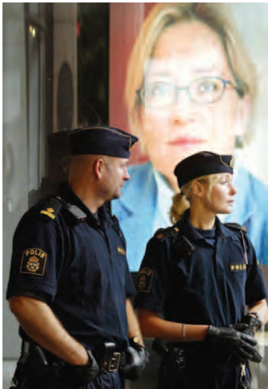
Polisen övervakar Anna Lindhs minneshögtid 19 september 2003.